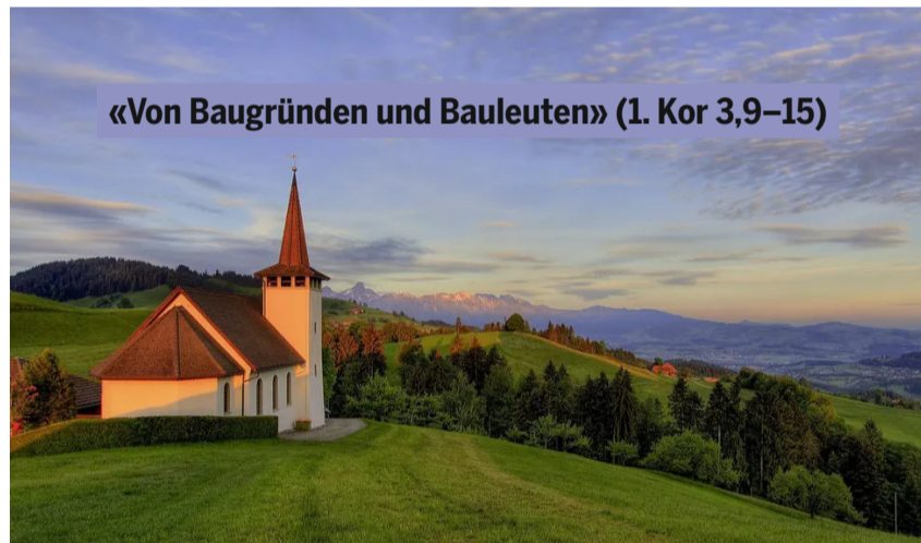
«Von Baugründen und Bauleuten» (1. Kor 3,9–15)