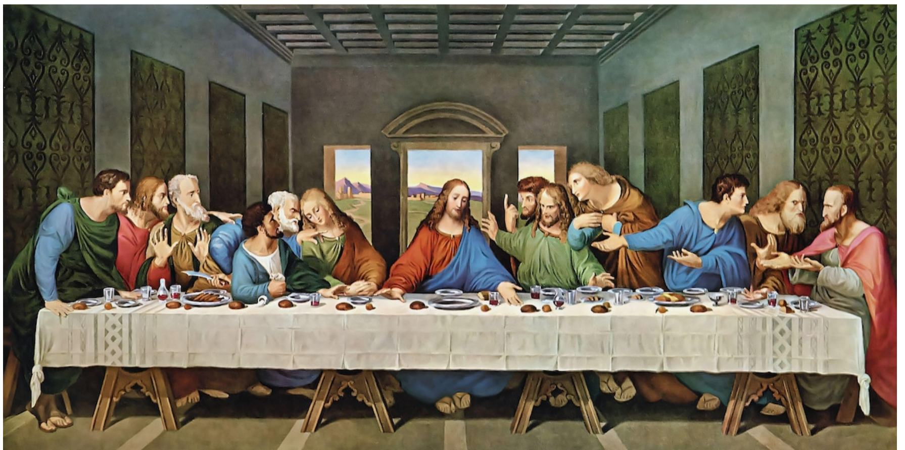
Das Abendmahl von Leonardo Da Vinci. Die Jünger nehmen ihn in die Mitte – ihn, der nicht mehr lange leben wird. Beim Feiern des Abendmahls erkennt die nachösterliche Gemeinde den Auferstandenen wieder in ihrer Mitte. Sie feiert das Leben und die Gemeinschaft, die stärker ist als der Tod.

In Oberhofen, Hilterfingen und Hünibach werden ebenfalls Heimgottesdienste gefeiert. Die Daten für den April finden Sie auf Seite 14. Seien Sie auch zu diesen Feiern herzlich willkommen!